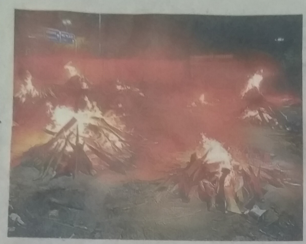
দিল্লিত রাস্তার পাশেই শবদাহ। (ডান দিকে) প্রস্তাবিত সেট্রাল ভিস্তা